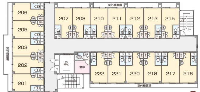
ワンルーム 専有面積:13.00㎡ 居室フロア 2F